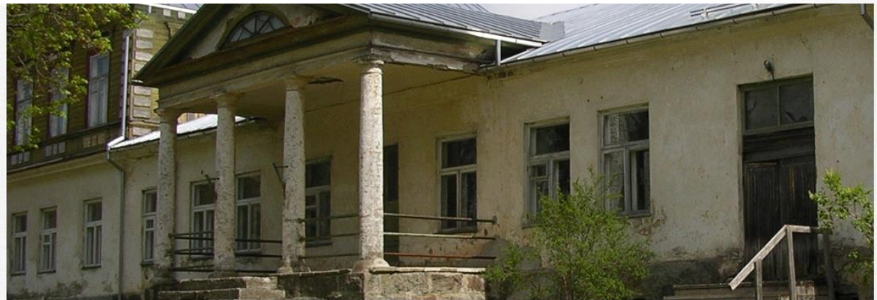
Orina mõis – "Mõisalugu uues kuues"

Sügis 2015 – õpilugu „Mõisa lugu uues kuues“. Kogemused keskkonnaga LearningApps.org. Valmis koduleht Orina mõisast loodud vahvatest äppidest.